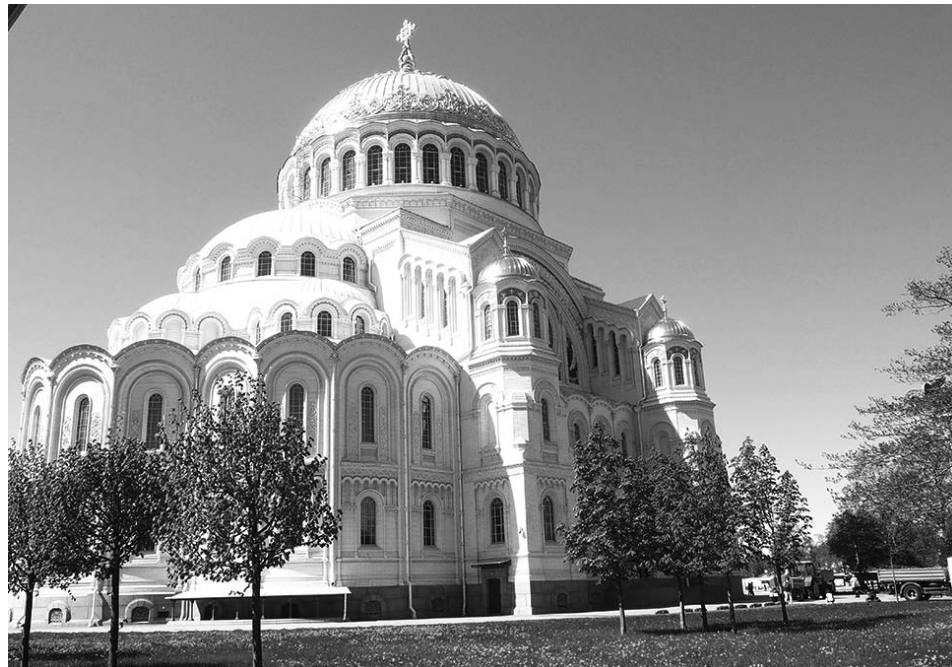
Главный Морской собор.

В Вытегре я оказался буквально через день после Кронштадта. И она смогла уди-