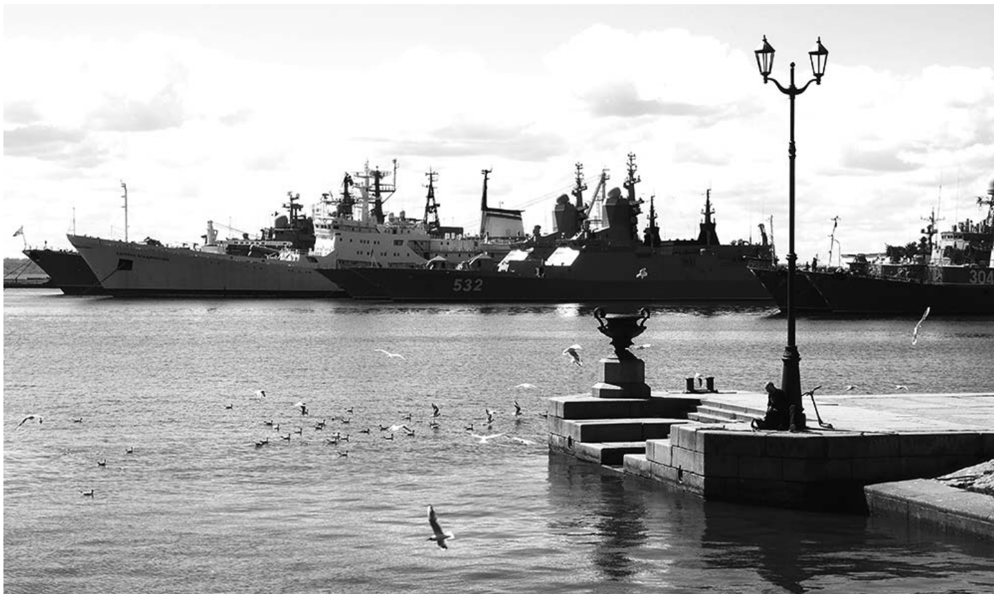
Корабли Балтийского флота.